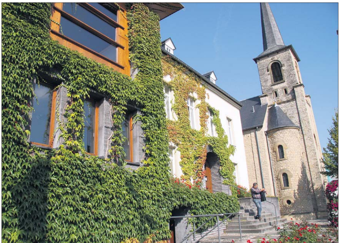
L'administration communale de Wellenstein se trouve à Bech / Kleinmacher