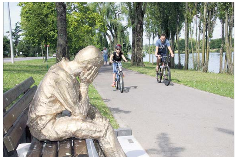
La statue du «penseur» de Bech-Kleinmacher

Bech-Kleinmacher a traditionnellement été un village de paysans et de vigneron. Du fait que la surface exploitable était relativement limitée dans la plaine, de nombreux exploitants possédaient des terres arables dans la plaine de Nennig du côté allemand, relié au Grand-Duché par un bac en amont de Bech-Kleinmacher. Aujourd'hui, l'agriculture est passée au second plan et le village est devenu un petit bourg mosellan typique à prédominance viticole. Saint Willi-