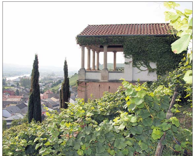
La chambre funéraire romaine au milieu des vignobles

Les mausolées de ce type, construits à flanc de coteau, comprenaient deux étages. La chambre funéraire qui constituait la partie principale de l'édifice était largement enterrée. Cette pièce voûtée de forme rectangulaire était décorée de fresques polychromes et surmontée d'une construction de mêmes dimensions en forme de petit temple funéraire. A Bech, un couloir souterrain voûté de 7,60 mètres de long et comportant plusieurs marches menait à la chambre funéraire proprement dite. Celle-ci mesurait 6,10 mètres sur 4,30.