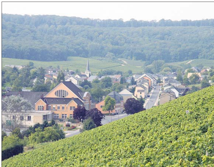
Les caves coopératives de Wellenstein face aux coteaux

L'entrepreneur Frank de Luxembourg a été chargé de la construction du bâtiment pour la somme de 1.729.207 francs de l'époque et l'on a confié aux établissements Duchscher de Wecker la construction des presses à vin. La première récolte des installations remonte quant